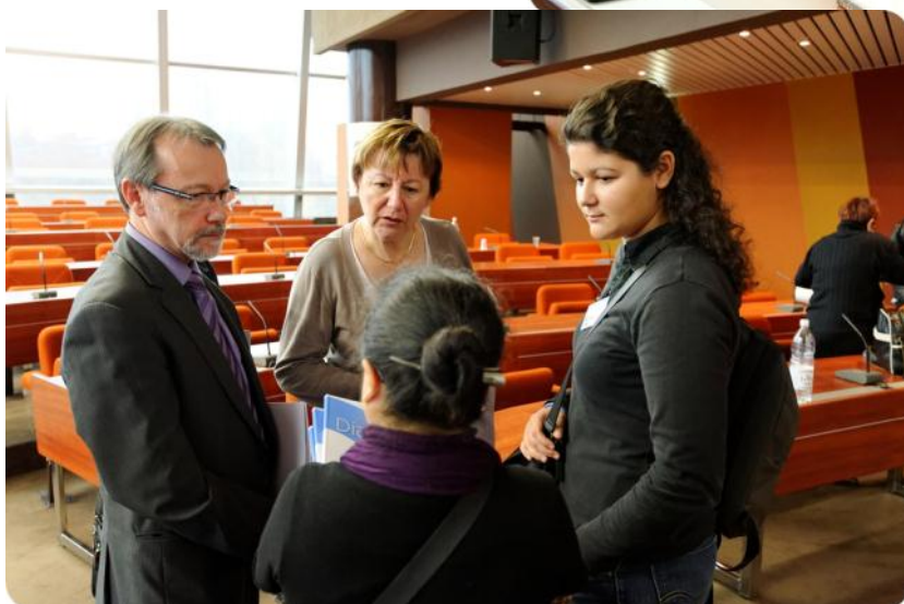
По завершению Конференции – обсуждение итогов