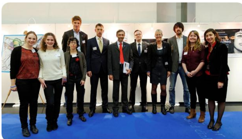
Сотрудники офиса МДФ-Европа, добровольцы и те, кто помог организовать и провести в ЕП мероприятия, посвященные МДД.

International Diabetes Federation - European Region