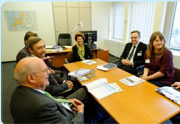
Приватная беседа с Еврокомиссаром г-жой Вассиллиу