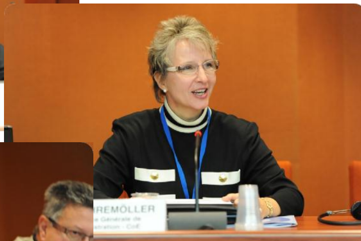
Уте Дельвемеллер, Генеральный директор, Администрация Совета Европы.