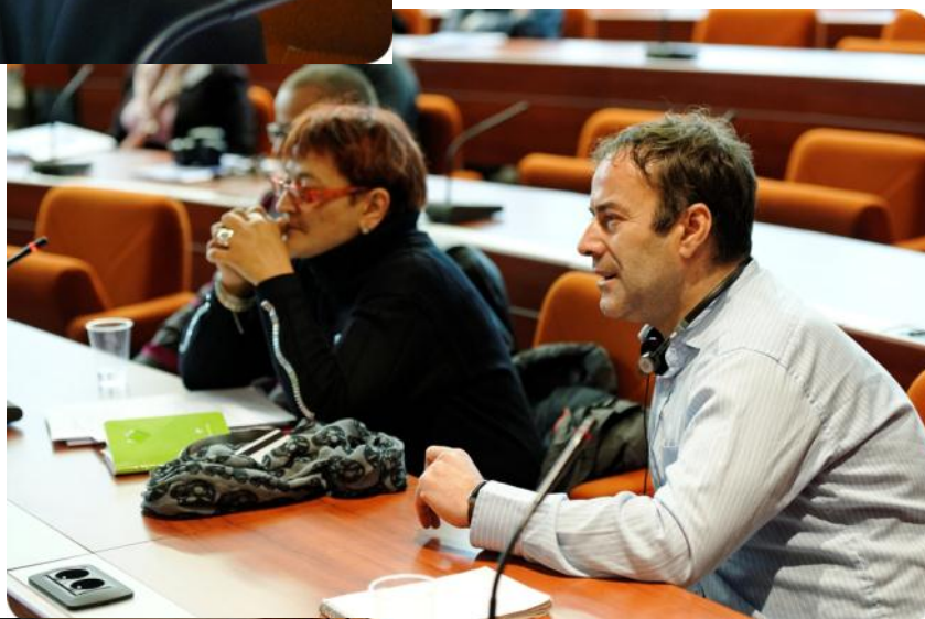
Участники Конференции задают вопросы