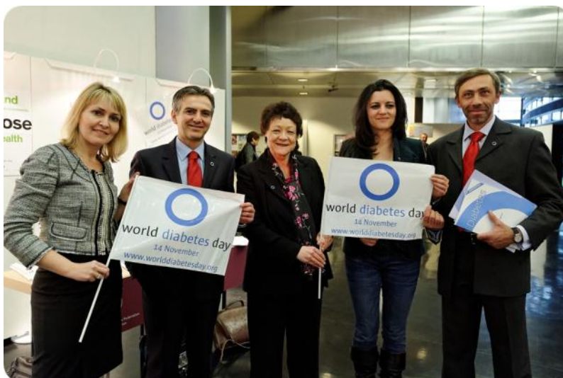
Члены ЕП Кристель Шальдемоз, Симон Бусутти, баронесса Сара Лундорф и Мариса Матиас (сопредседатель Рабочей группы ЕП по диабету) и Жоао Набиш (будущий Президент МДФ-Европа)